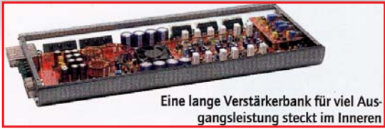
Eine lange Verstärkerbank für viel Ausgangsleistung steckt im Inneren

Die Rodek kommt im edlen Alu-Design. Man vermisst die Kühlrippen, was aber am durchdachten Power-Management liegt. Heiße Luft wird über den internen Lüfter nach außen geblasen, wer nach oben hin ausreichend Platz übrig lässt, kann die R680N auch in beengte Umgebung einbauen, Mit einer zeitgemäßen Headunit lassen sich viele Kombinationen für ihren Einsatzzweck durchdenken. Am besten gefällt uns die Idee, ein vollaktives Drei-Wege-Frontsystem zu fahren. Mit über hundert Watt pro Kanal hat man sehr reichlich Reserven nach oben, was sich klanglich erfahrungsgemäß bemerkbar macht. Mit leistungstechnisch gesehen viel Headroom spielen Frontsysteme einfach souveräner und stressfreier. Will man nur ein Zweiwegesystem ansteuern, kann man die verbleibenden beiden Kanäle in Brücke schalten, was dem so angeschlossenen Subwoofer knapp 250 Watt beschert. Diese Leistung ist auch sauber, wie unsere Labortests beweisen. Geringe Verzerrungen und ein guter Signal-Rauschabstand zeugen von der Qualität des Signals. Die Eckfrequenz des Hochpasses ist mit 10 Hz tief genug, um einen Subsonicfilter für den Subwoofer einstellen zu können, was den Sub entlastet und vor Frequenzen schützt, die er sowieso nicht beherrscht.